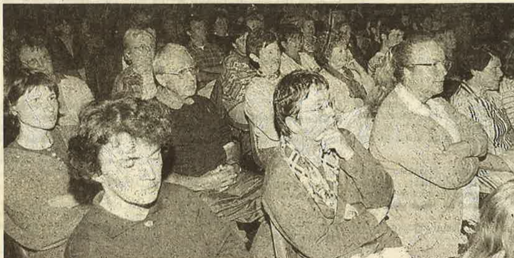
Le concert a finalement eu lieu salle des fêtes, en lieu et place du manoir de la grange.

Les deux compères, en spécialistes de Boby Lapointe , ont terminé par un morceau de leur idole. Un détour qu'a manifestement apprécié le public, mais qui n'a pas eu l'heur de plaire à certains : « Où est le gallo là-dedans ? ». Une question que ne se sont pas posée les quelques francs-tireurs partis faire leurs « assemblées off » dans le bistrot